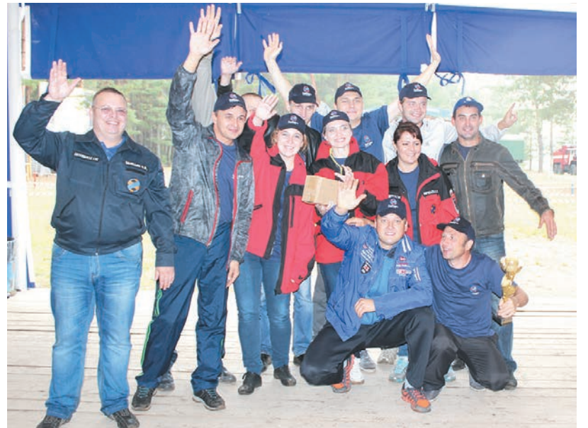
Победительница соревнований – команда НАСФ Воткинской ГЭС.