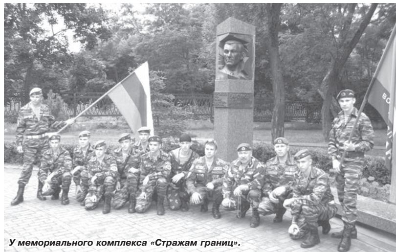
У мемориального комплекса «Стражам границ».

Это была реконструкция первого боя, принятого защитниками Брестской крепости, увидеть которую своими глазами посчастливилось курсантам Чайковского военно-спортивного клуба «Десантник».