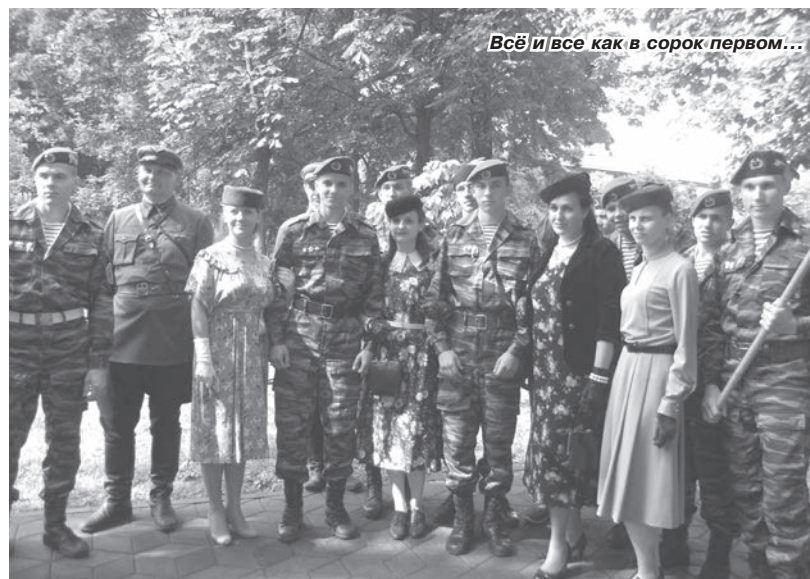
Все и все как в сорок первом...

связи с этим сразу вспомнились пронзительные в своей трагичности строчки из песни «Каждый четвёртый», которую когда-то блистательно исполнил ансамбль «Песняры»: